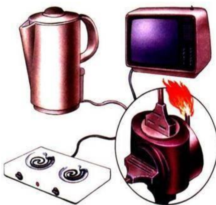
Перегрузка электропроводов kuhta.dan.su

9) Помни: от твоих первых действий зависит, насколько быстро будет распространяться дым и огонь по подъезду.