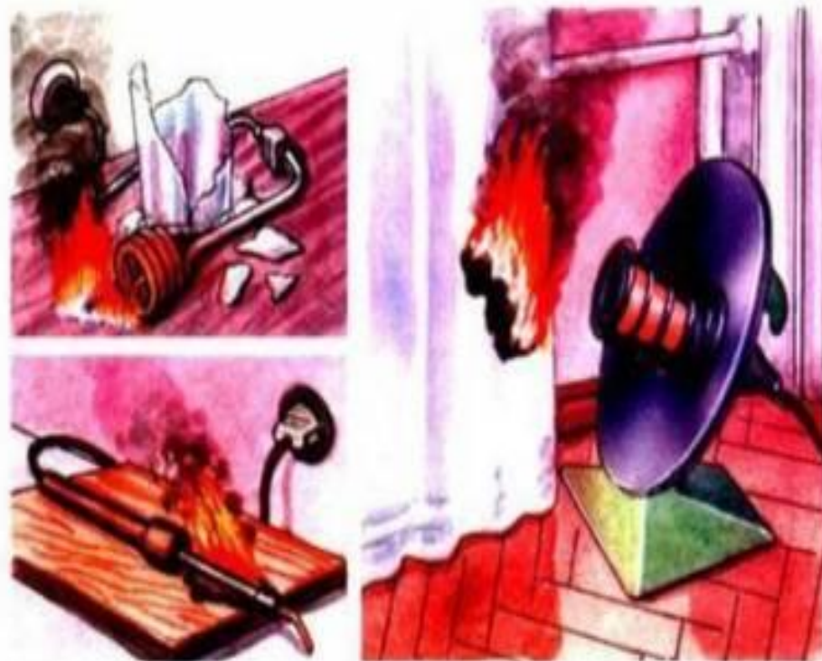
Оставление без присмотра электрических нагревателей