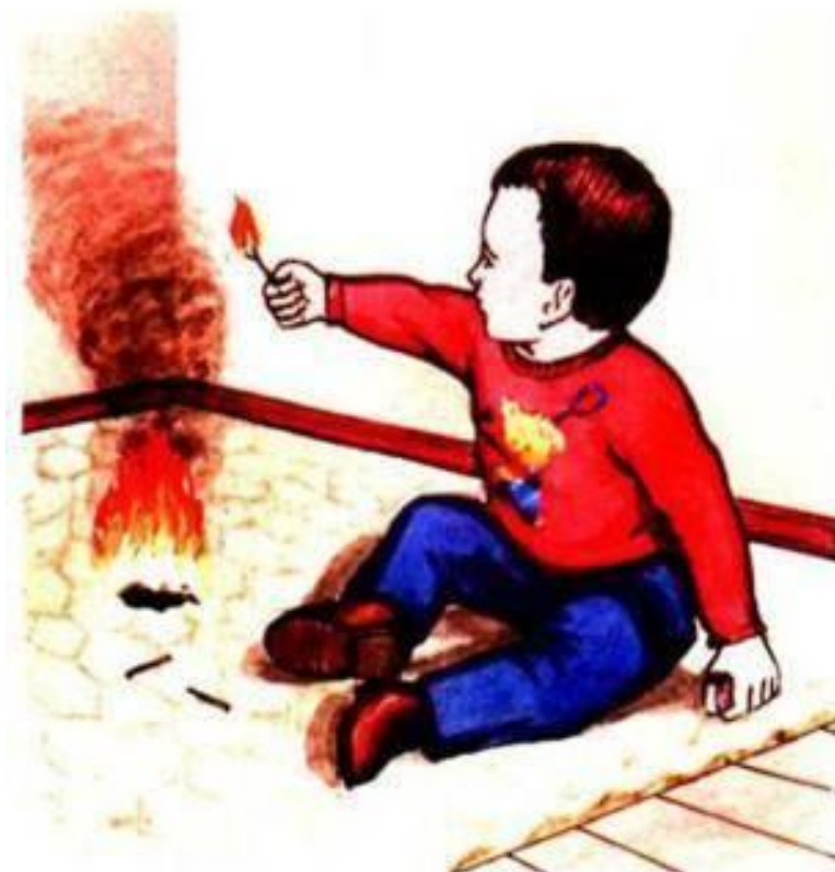
Детская шалость

ЗНАЙ: вызов пожарной команды просто так, из шалости или любопытства, не только отвлечёт спасателей от настоящего происшествия, но и будет иметь весьма неприятные последствия. Заведомо ложный вызов пожарных (так же, как и милиции, "скорой