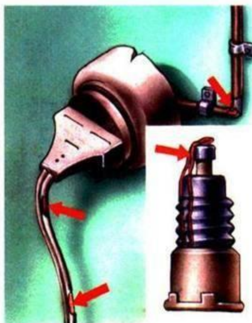
Неисправность электропроводки Пользование самодельными предо...

1) Если ты почувствовал запах дыма или увидел огонь, сразу позвони пожарным. Если огонь тебе не угрожает, сделать это можно с домашнего телефона. В других случаях лучше сразу покинуть квартиру, а затем вызвать пожарных по телефону 01. Обязательно сообщи о пожаре взрослым.